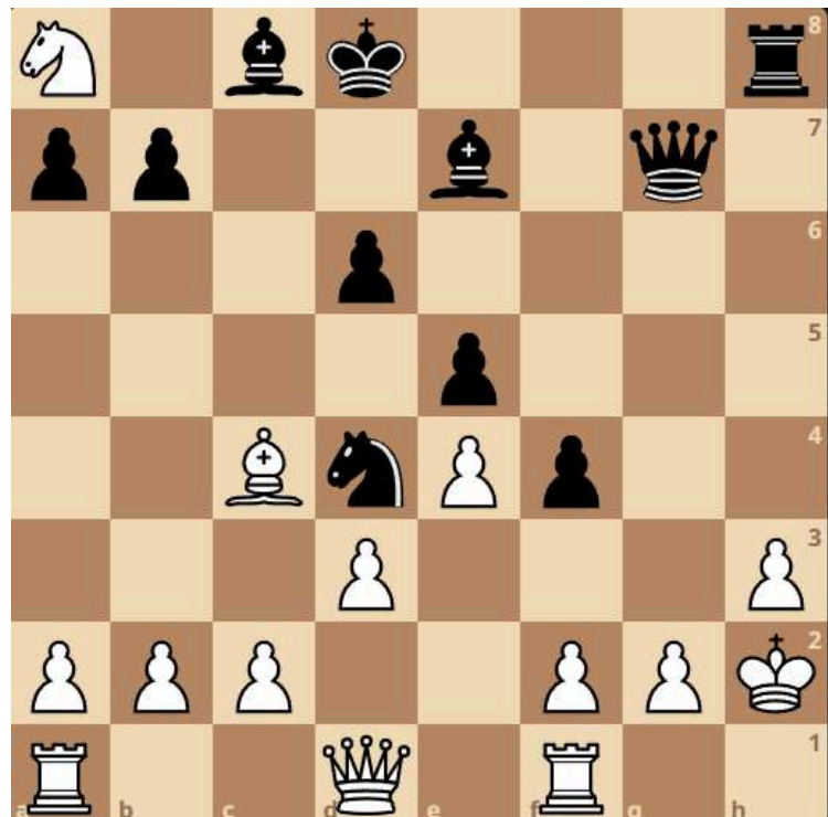
Yeremeichuk - Koch

Wenige Züge später wurde Remis vereinbart. Schwarz hatte hier allerdings die Chance doch siegreich aus der Partie zu gehen.