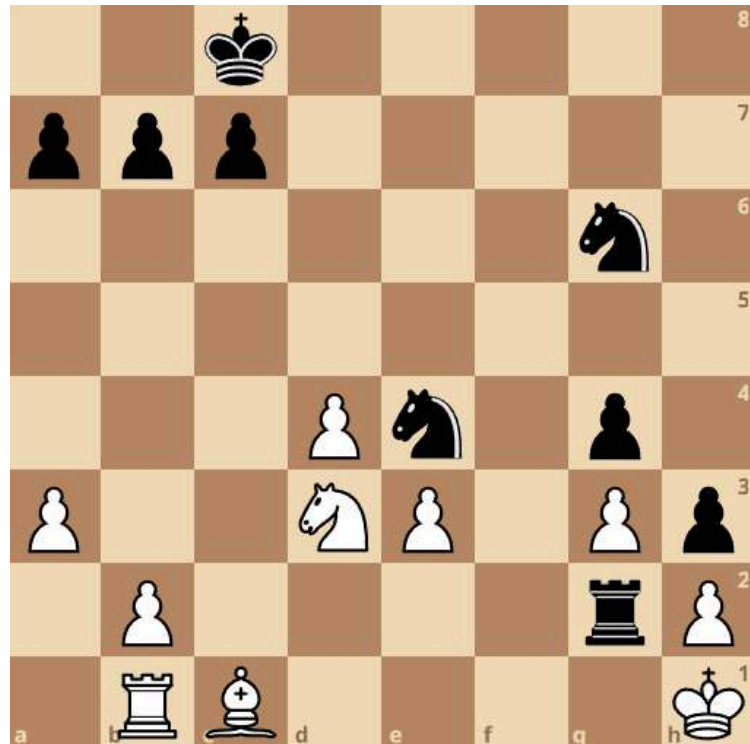
Soppe - Bone

Drei Kandidatenzüge... nur einer gewinnt: